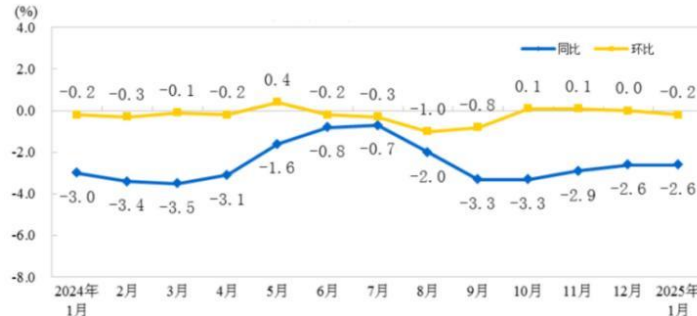
图3 生产资料出厂价格（左）购进价格（右）涨跌幅

2025年1月份，全国工业生产者出厂价格和购进价格同比均下降2.3%降幅均与上月相同；环比均下降0.2%。1月份，工业生产者出厂价格中，生产资料价格下降2.6%，影响工业生产者出厂价格总水平下降约1.95个百分点。其中，采掘工业价格下降4.9%，原材料工业价格下降1.9%，加工工业价格下降2.7%。生活资料价格下降1.2%，影响工业生产者出厂价格总水平下降约0.31个百分点。其中，食品价格下降1.4%，衣着价格下降0.1%，一般日用品价格上涨0.5%，耐用消费品价格下降2.6%。